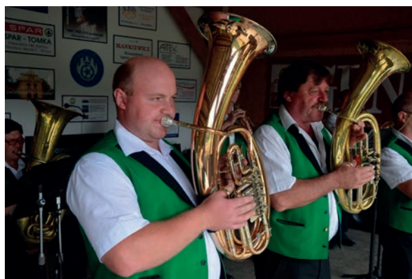
Pout'ové odpoledne s dechovkou na hřišti

příležitostech. Je potřeba vysvětlit, proč k tomuto kroku došlo. Každý starosta, který bude sedět v tom horkém křesle, bude mít starost o peníze. Bez těch nejde nic nebo jen něco málo. Pokud mu to ovšem nebude jedno. Máme schválený Program rozvoje obce na dvě volební období dopředu a z něj vyplývá potřeba cca padesát milionů korun bez dotací a cca tři a půl milionu korun na zpracování a přípravu projektové dokumentace na tyto záměry. Bez ní nemůžeme žádat o jakoukoliv dotaci a nebude zajištěn jakýkoliv rozvoj a u toho bych nechtěl být. Ano, sice máme pár milionů našetřeno, což mimochodem Pačejov také dlouho nepamatuje, ale jenom náš podíl na financování kanalizace a čistírny bude cca dvanáct milionů korun a já, když to půjde si nechci půjčovat, ale našetřit si. Ten návrh se dotýkal všech majitelů nemovitostí, nejvíce a to z poloviny podniků a podnikatelů, z větší části majitelů hektarů pozemků a lesů a všechny tyto skupiny na to přeci mají, protože buď hospodaří nebo pronajímají. Ti nejsou chudí. A z nejmenší části se tento návrh dotýkal většiny občanů, to je těch, co vlastní rodinný dům se zahradou. Ty by to stálo cca 400 korun ročně, tj. 35 korun měsíčně. A obec mohla mít půl milionu ročně v pokladně a mohla připravovat projekty a reagovat na potřeby občanů. Jak se dočtete dále – nebude. Škoda pro nás pro všechny.