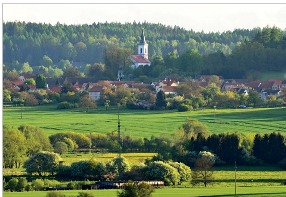
Zemědělské výrobě se v katastru obce věnuje hned několik společností