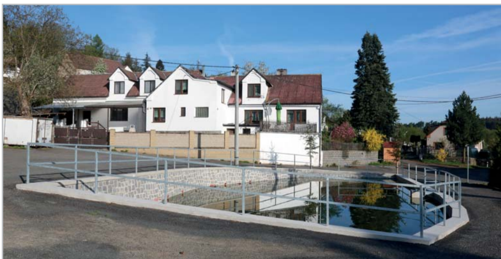
V letech 2016–2018 byla provedena generální oprava návesních rybníčků v místní části Týřovice a Strážovice