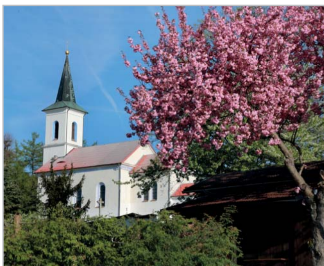
Dominantou obce je kostel Panny Marie Sněžné

Nejstarším zájmovým spolkem je včelařský spolek. Ten byl založen již roku 1903. Dru-