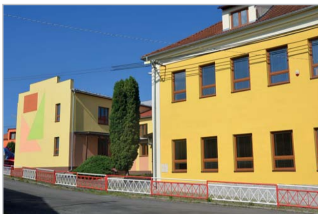
V posledních letech investovala obec do rekonstrukce některých budov

hým nejstarším spolkem je Sbor dobrovolných hasičů Pačejov, založený v roce 1907. Tento spolek je velice úspěšný v hasičském sportu mládeže a žen, jejichž družstva dosahují pravidelně významných úspěchů v rámci okresu Klatovy. Dalším spolkem je Sbor dobrovolných hasičů Velešice, který byl založen roku 1920. Jako jediný spolek ve Velešicích pořádá během roku celou řadu akcí jak pro mládež, své členy, tak i pro