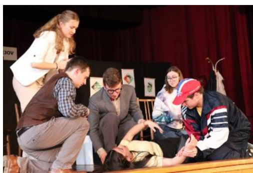
Divadelní představení v kulturním domě